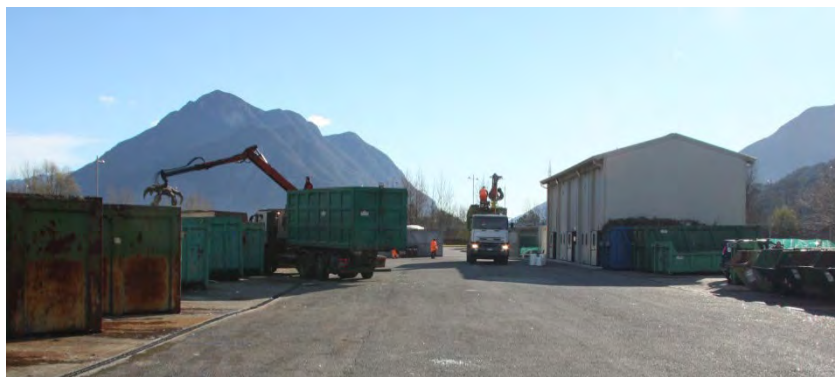
PIAZZOLA ECOLOGICA – AREA TRATTAMENTO INERTI